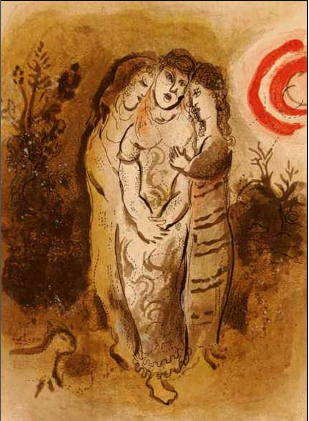
Marc Chagall – Rut, Noomi und Orpa